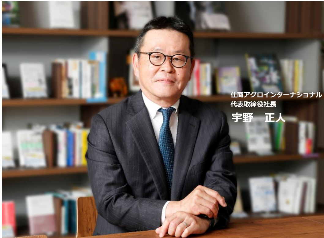
住商アグロインターナショナル 代表取締役社長

私たちは、常に新たな価値を創造し、 お客様に信頼されることをモットーに 業界でNO.1のトレーディングカンパニー を目指します。